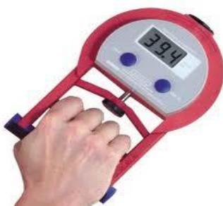
شکل ۱- نیروسنج دیجیتال

آزمون تنظیم زاویه دست برتر: برای ارزیابی دقت تنظیم زاویه دست برتر از ابزار ساخته شده توسط بهرامی و همکاران (۱۳۸۹) که با الگوگیری از نمونه خارجی طراحی و ساخته شده بود، استفاده گردید. نمونه خارجی این وسیله در سال (۱۹۸۸) در کشور اتحاد جماهیر شوروی سابق برای ارزیابی عملکرد روانی حرکتی ورزشکاران معرفی شد. شایان ذکر است که روایی و پایایی این ابزار را بهرامی و همکاران (۱۳۸۹) از طریق ضریب همبستگی با ابزار اصلی معادل (۰/۷۵) در سطح معناداری (۰/۱) و روایی آن از طریق آزمون مجدد را معادل (۰/۸۹) گزارش کرده‌اند (۸،۱۲). برای اجرای آزمون، آزمودنی روی صندلی نشسته و ساعد خود را در محل مخصوص دستگاه که روی میز گذاشته شده بود، قرار می‌داد. ابتدا، آزمودنی چند بار زاویه‌های مختلف را تمرین کرده و نشان می‌داد. سپس، از وی درخواست می‌شد که با چشمان بسته هر سه حالت را سه بار نشان دهد؛ برای مثال، از آزمودنی خواسته می‌شد که این عمل را با زاویه کم ( 25^{\circ} - 30^{\circ} )، متوسط ( 40^{\circ} - 50^{\circ} ) و زیاد ( 70^{\circ} - 75^{\circ} ) و با چشمان بسته نشان دهد. این عمل در زاویه‌های مختلف سه بار تکرار می‌شد و در هر حالت مقدار اشتباهات آزمودنی به درجه محاسبه گشته و میانگین قدرمطلق آن‌ها ثبت می‌گردید. لازم به ذکر است که برای جلوگیری از تأثیر خستگی بر آزمون‌های تنظیم زاویه و نیرو، آزمون‌ها در روز استراحت آزمودنی‌ها و در نوبت صبح انجام می‌گرفت.