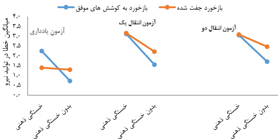
شکل ۲- میانگین خطای تولید نیرو در گروه‌های بازخورد به کوشش‌های موفق و جفت‌شده در شرایط با و بدون خستگی ذهنی در آزمون‌های یادداری، انتقال یک و انتقال دو

نتایج آزمون تحلیل واریانس دوطرفه در آزمون‌های یادداری، انتقال یک و انتقال دو (جدول شماره چهار) نشان می‌دهد که اثر اصلی خستگی ذهنی معنادار است. نتایج مقایسه‌های دوگانه نشان داد که در هر سه آزمون، گروه‌هایی که در شرایط خستگی ذهنی تمرین کرده بودند، خطای بیشتر و یادگیری کمتری داشتند؛ اما اثر اصلی بازخورد و اثر تعاملی بازخورد با خستگی ذهنی در آزمون‌های یادداری، انتقال یک و انتقال دو (به‌جز اثر تعاملی در آزمون یادداری) معنادار نیست.