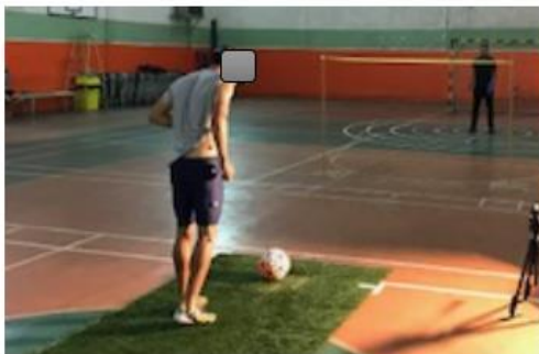
شکل ۱- نحوه انجام دادن تکلیف

برای بررسی عملکرد گروه‌ها از متغیرهای کینماتیکی حرکت شامل تغییرپذیری هماهنگی در جفت‌شدگی مچ-زانو و تغییرپذیری هماهنگی در جفت‌شدگی زانو-ران استفاده شد که در ادامه نحوه محاسبه و تحلیل آماری آن‌ها ارائه شده است. قبل از انجام هرگونه محاسبه، ابتدا و انتهای حرکت مشخص شد و اولین فلکشن در ران به‌عنوان شروع حرکت و لحظه برخورد توپ با پا به‌عنوان پایان حرکت در نظر گرفته شد. فیلم‌ها در نرم‌افزار کینووا ۱ تحلیل شدند (۲۴). در این نرم‌افزار مسیر حرکت پنج نشانگر در صفحه‌ای دوبعدی ردیابی شد و مختصات دوبعدی نشانگرها در هر فریم از فیلم به‌عنوان خروجی به‌دست آمد. اطلاعات خروجی مختصات دوبعدی با استفاده از فیلتر باترورث ۲ مرتبه چهار هموار شدند. با استفاده از مختصات دوبعدی به‌دست‌آمده و با به‌کارگیری روابط کسینوسی در مثلث، سه زاویه مچ پا، زانو و ران در هر فیلم و برای همه فریم‌ها با استفاده از نرم‌افزار متلب محاسبه شدند (۱۵).