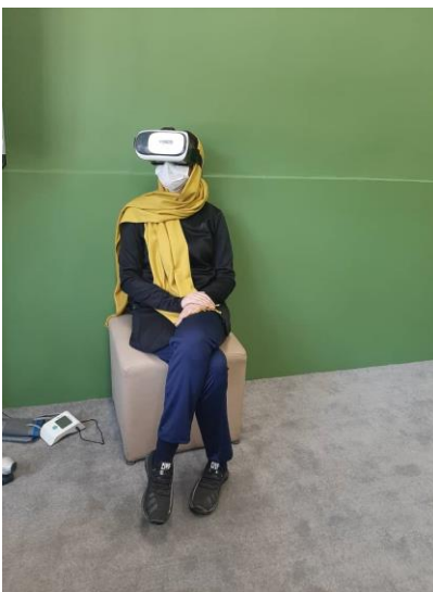
تصویر شماره ۲- تمرین واقعیت مجازی

گروه واقعیت مجازی تمرینات را با حس غوطه‌وری با دیدن ویدئوی ۳۶۰ درجه دوچرخه‌سواری تصویرسازی می‌کنند. حس حرکتی ناشی از دیدن این ویدئوها بیمار را در حالت غوطه‌وری برده و تحریک سیستم عصبی مرکزی باعث یادگیری حرکتی و شناختی می‌شود. زمان این مداخله مانند دیگر مداخلات بود. در ادامه ابزار جمع‌آوری اطلاعات آورده شده است (تصویر شماره ۲).