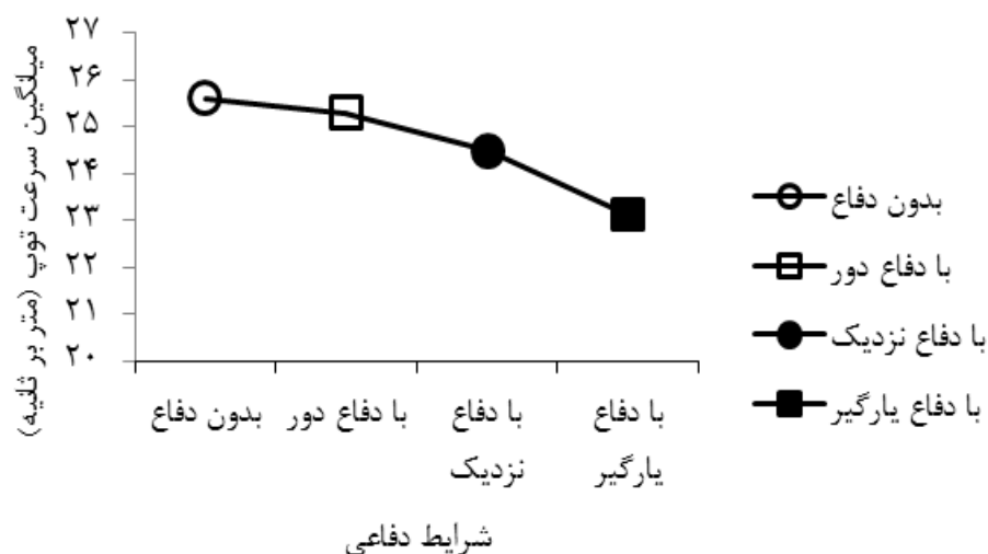
شکل ۴- میانگین سرعت توپ در شرایط دفاعی مختلف

نتایج آزمون تحلیل واریانس با اندازه‌های تکراری نشان داد که بین میانگین سرعت توپ در چهار شرایط دفاعی مختلف تفاوت آماری معناداری وجود داشت ( F_{(3,33)} = 12.733, P = 0.000 ). همان‌طور که در شکل شماره چهار نشان داده شد، میانگین سرعت توپ در شرایط حضور دفاع یارگیر درمقابل حضورنداشتن دفاع، حضور دفاع دور و حضور دفاع نزدیک کاهش یافت ( 23/13 \pm 1/72 متر بر ثانیه به ترتیب در مقابل 25/62 \pm 0/95 ، 25/29 \pm 1/25 و 24/50 \pm 1/49 ). همچنین، نتایج آزمون تعقیبی بونفرونی نشان داد که در شرایط حضور دفاع یارگیر با حضورنداشتن دفاع و حضور دفاع دور، تفاوت معناداری مشاهده شد (به ترتیب P = 0.007, P = 0.001 ).