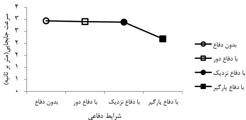
شکل ۳- میانگین سرعت جابه جایی در شرایط دفاعی مختلف

همان طور که در شکل شماره سه نشان داده شده است، نتایج مربوط به آزمون تحلیل واریانس با اندازه های تکراری با تصحیح گرینهاوس-گیزر در مورد سرعت جابه جایی فرد نشان داد که تفاوت معناداری بین شرایط مختلف دفاعی وجود داشت ( F(1.335,14.682) = 8.680, P = 0.007 ). نتایج آزمون تعقیبی بونفرونی نشان داد که میانگین سرعت جابه جایی کل بدن در شرایط حضور دفاع یارگیر در مقابل حضور نداشتن دفاع، حضور دفاع دور و حضور دفاع نزدیک کاهش یافته است ( 2/19 \pm 0/58 متر بر ثانیه به ترتیب در مقابل 2/94 \pm 0/56 ، 2/91 \pm 0/59 و 2/089 \pm 0/75 متر بر ثانیه) که در شرایط دفاع یارگیر با حضور نداشتن دفاع و حضور دفاع دور تفاوت معنادار مشاهده شد (به ترتیب P = 0.022 = 0.008 ).