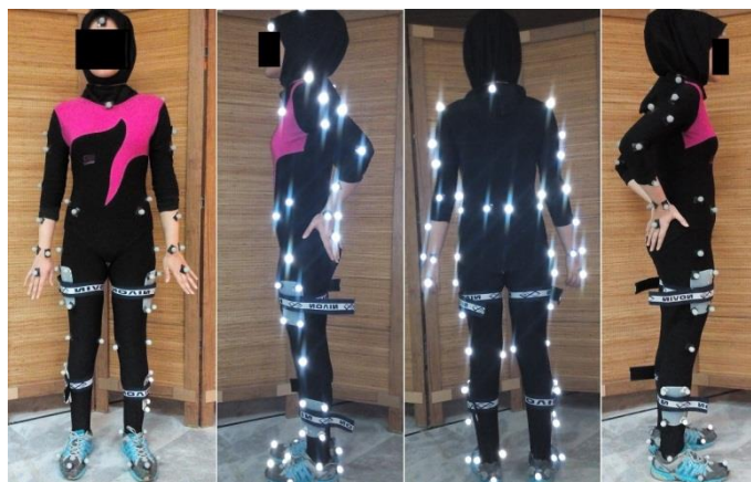
شکل ۱- محل نصب نشانگرها

سپس، با توجه به هدف انجام آزمون و نوع تکلیف حرکتی، ۲۵ عدد نشانگر روی مفاصل و برجستگی‌های آناتومیکی بدن شامل: استخوان جناغ سینه، زائده آکرومیون چپ، زائده آکرومیون راست، زائده داخلی و زائده خارجی آرنج راست، زائده داخلی و زائده خارجی آرنج چپ، کناره داخلی و کناره خارجی مچ دست راست، کناره داخلی و کناره خارجی مچ دست چپ، سر استخوان ران پای راست و سر استخوان ران پای چپ، اپی‌کندیل داخلی و خارجی زانوی پای راست، اپی‌کندیل داخلی و خارجی زانوی پای چپ، قوزک داخلی و قوزک خارجی مچ پای راست، قوزک داخلی و قوزک خارجی مچ پای چپ، انتهای انگشت دوم پای راست و انتهای انگشت دوم پای چپ هر شرکت‌کننده نصب گردید تا اطلاعات جنبشی مربوط به حرکات فراهم شود (شکل شماره یک). شایان‌ذکر است نشانگرها روی قسمت‌هایی از پوست نصب شدند که کمترین مقدار حرکت و لغزش اضافی روی استخوان‌ها را داشته باشد تا از هرگونه حرکت اضافی که ممکن است باعث پایین‌آمدن دقت یافته‌های پژوهش شود جلوگیری گردد.